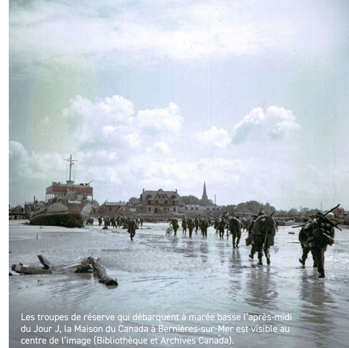
Les troupes de réserve qui débarquent à marée basse l'après-midi du Jour J, la Maison du Canada à Bernières-sur-Mer est visible au centre de l'image.

Ce musée et centre culturel canadien unique, axé sur la jeunesse, raconte l'histoire incroyable et émouvante de jeunes d'une génération passée qui ont fait de grands sacrifices pour garantir le maintien des libertés dont nous bénéficions encore aujourd'hui. Leur engagement guide et façonne encore notre pays.