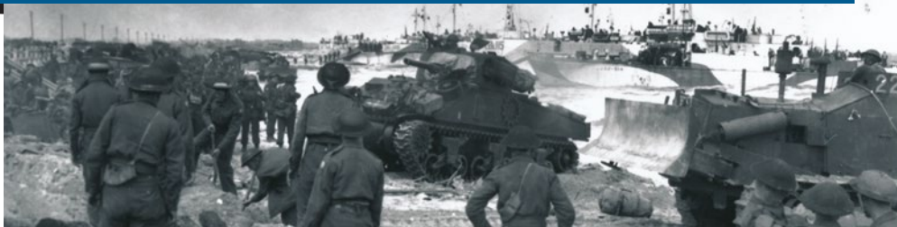
Chars du 1st Hussars et soldats du Royal Winnipeg Rifles, du Regina Rifles ou des troupes du groupe de plage débarquant près de Courseulles-sur-Mer, 6 juin 1944 (MDN / Bibliothèque et Archives Canada / PA-128791).

ROSS MUNRO, CORRESPONDANT DE GUERRE CANADIEN, 1945