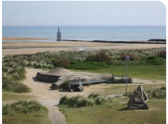
Bunker d'observation construit en 1944. Photo de 2018.