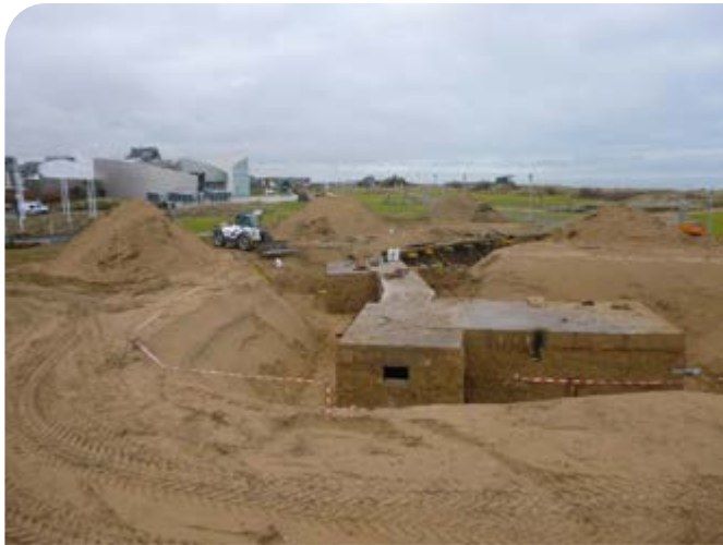
Poste de commandement souterrain construit entre 1941 et 1942. Photo de 2013 prise pendant des travaux.

Sais-tu qu'encore aujourd'hui, de nombreux vestiges du Mur de l'Atlantique, construits durant l'occupation allemande de la France, sont enfouis devant le Centre Juno Beach ? Deux bunkers ont été désensablés par des équipes de bénévoles. Il s'agit d'un poste de commandement et d'un bunker d'observation. Imagine l'intérieur de l'un ou l'autre de ces bunkers en répondant aux questions suivantes.