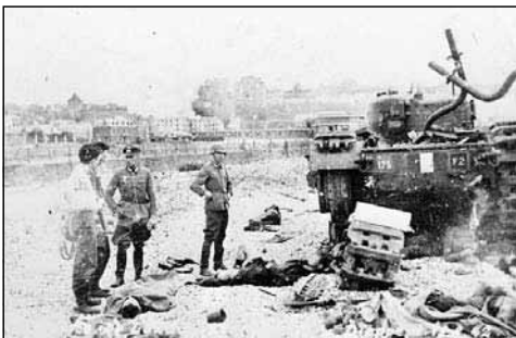
Archives Nationales du Canada C-017293