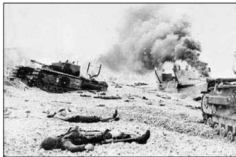
Archives Nationales du Canada C-014160