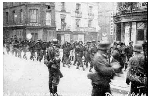
Archives Nationales du Canada PA-200058

De l'autre côté de la pièce, il y a un panneau qui explique le Raid de Dieppe qui a eu lieu le 19 août 1942.