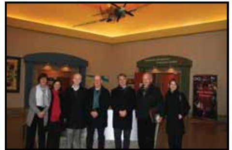
Au cours de la Seconde Guerre mondiale, l'Australie était impliquée en tant que membre du Commonwealth. Lors de la campagne de Normandie, 20 000 Australiens servaient en Grande-Bretagne. Près de 2 500 marins australiens ont participé au Jour J et 10 escadrilles de la Royal Australian Air Force basées en Grande-Bretagne totalisaient près de 14 000 hommes.

L'objectif de la visite visait à nourrir une réflexion sur la création de centres d'interprétation sur les différents sites où les Australiens ont combattu lors de la Première Guerre mondiale. Monsieur Griffin s'est montré très intéressé par le contexte de la création du Centre Juno Beach, son fonctionnement, sa fréquentation autant que par ses contenus. Les visiteurs se sont rendus sur la plage avant d'aller au Mémorial de Caen, l'autre objectif de la délégation pour un après-midi studieux en Normandie. En Australie, le ministre Alan Griffin est en charge de programmes pour plus de 400 000 vétérans, veuves et personnes dépendantes.