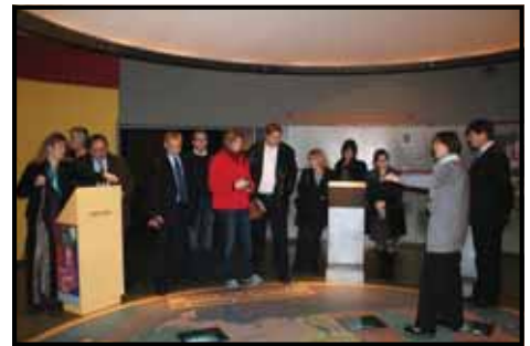
Visite commentée du musée.