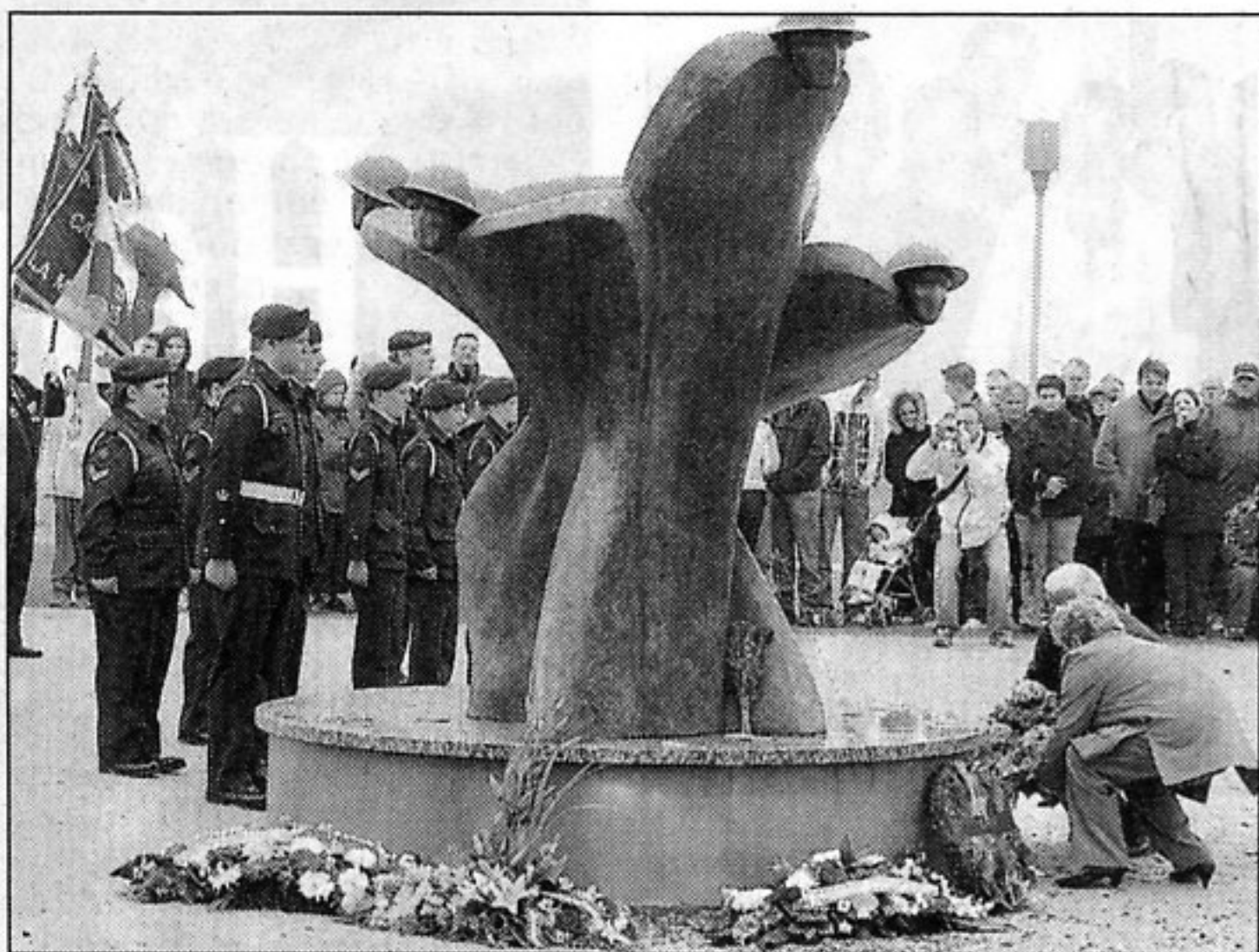
Dépôt de gerbes au pied du monument du Centre Juno Beach, lundi matin, lors de la cérémonie du 6 Juin.